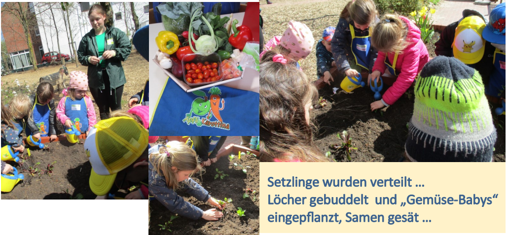
Setzlinge wurden verteilt ... Löcher gebuddelt und „Gemüse-Babys“ eingepflanzt, Samen gesät ...

WELCHES Gemüse kennt Ihr und findet es lecker? WELCHES Gemüse gibt es sonst noch und wie funktioniert das mit dem Wachsen?