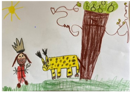
Schreibkraft: Carolin Fürst

Der Daumen konnte sich richtig gut aus mit Klimaschutz. Ich bin richtig aufge-regt, ob das jetzt wirklich in das Heft (Gemeindebrief) kommt.