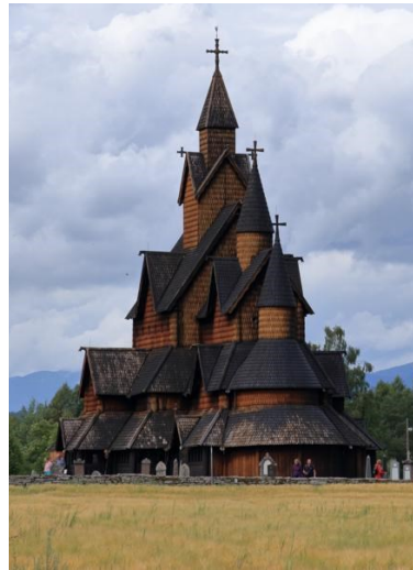
Die Stabkirche Heddal in Notodden

kingerschach gespielt. Die gesamte Gruppe hat sich supergut verstanden und viele von uns haben neue Freundschaften geschlossen.